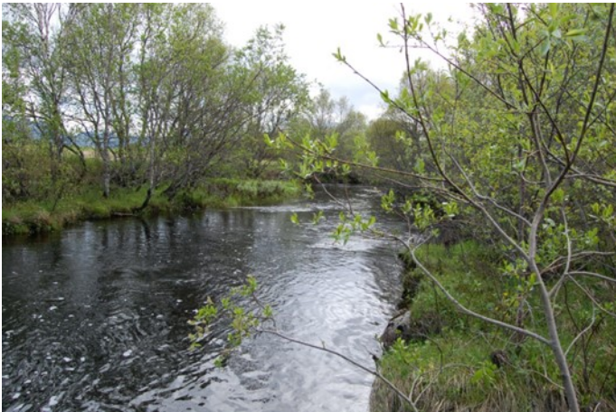
Bilde 1. Kantvegetasjon med trær.

Det er krav om en vegetasjonssone på minimum 2 meters bredde mot vassdrag. Det er tilstrekkelig at kantsonen er tilsådd med gras og det er tillatt å høste hele sonen. I utgangspunktet er det ikke tillatt med sprøyting i kantsonen, men Mattilsynet kan gi dispensasjon. Søknadsskjema og instruks om hvor søknad sendes finner du på Mattilsynet.no . Det er ikke krav til planting med busker og trær i kantsonen. Etablert kantsone kan ikke fjernes uten tillatelse fra kommunen.