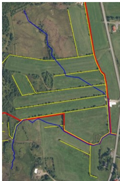
▲ Bilde 1. Drenssystem.