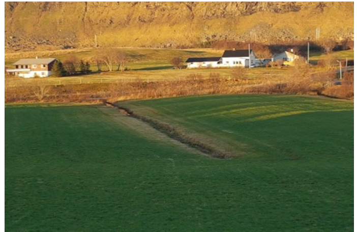
Bilde 2. Ugjødslet kantsone.

Dette er eksempel på en større bekk med godt etablert kantvegetasjon. Det er tillatt med skjøtsel av denne sonen, men det er krav om søknad til kommunen. Eksempel på skjøtsel er kutting av greiner og stammer som er i veien på siden mot jordbruksarealet. Dersom hele trær fjernes vil det være krav om nyplanting.