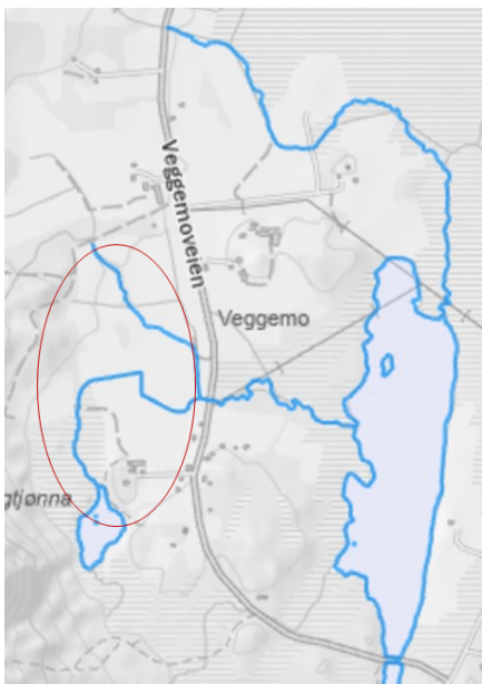
▲ Figur 1. Eksempel på vassdrag med anadrom strekning.

Figur 1 viser et eksempel der deler av en landbrukskanal er registrert som anadrom strekning. Den røde sirkelen viser opprinnelig system. Bilde 1 viser dagens dreneringssystem innenfor den røde sirkelen. Kanaler markert med gul farge og nye hovedløp med rødt. Figur 2 viser bekk der det er registrert elvemusling. Dette er en rødlistet art og tiltak i og nær vassdraget krever ekstra oppmerksomhet. Bilde 2 viser elvemusling fra en bekk der det i en lang periode var dårlige forhold. Elvemuslingen er særlig sårbar for partikler.